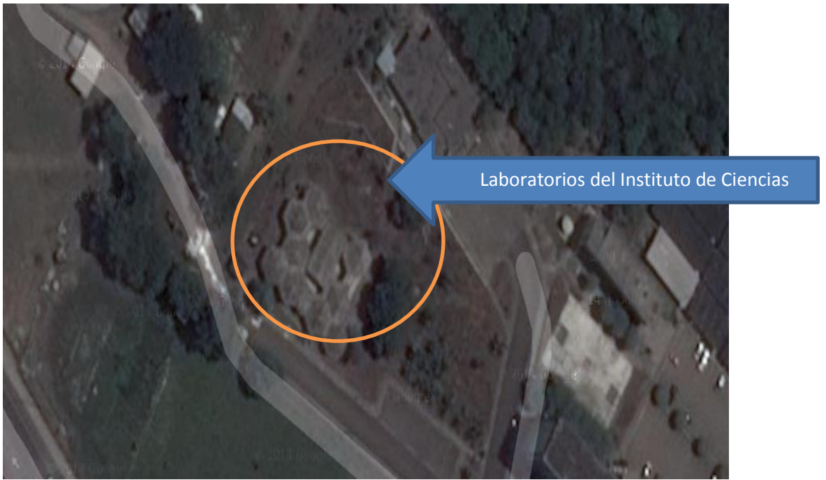
Figura 2. Micro localización