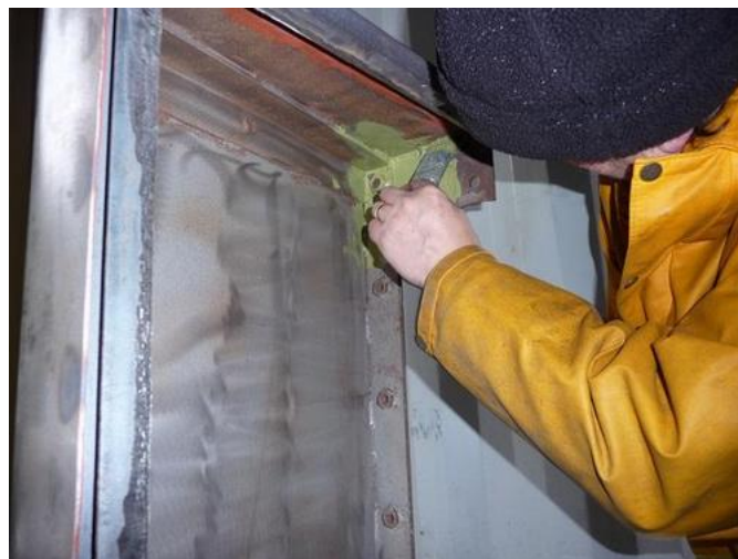
Figura nº 7. Aplicación de pintura anticorrosiva.

La protección anticorrosiva está formulada con un pigmento resistente a la herrumbre como plomo cromado o cinc cromado y un adhesivo químico, resistente a la humedad; empleado para proteger las superficies como el acero y hierro.