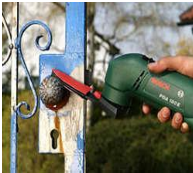
Figura nº 6. Métodos para la protección de las rejas metálicas.

No obstante, si ya aparecieron las manchas cobrizas, lije la zona afectada y aplique un producto transformador de óxido que genera una película protectora. Luego, coloque una base anticorrosiva y finalmente, aplique el esmalte. Otra alternativa es aplicar pintura epóxicas, pues presenta gran resistencia a la humedad.