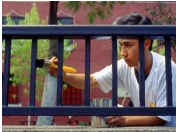
Figura nº 5. Reparaciones que se realizan para la protección de las rejas metálicas.

El óxido es el enemigo número uno de los metales. El daño empieza a gestarse de manera silenciosa y no es evidente hasta que corroe la superficie de las barandas, las ventanas o las rejas. En muchos casos, puede dejarlas inservibles. Este problema se presenta debido a la humedad del medio ambiente y se acelera en zonas expuestas al salitre y la brisa marina.