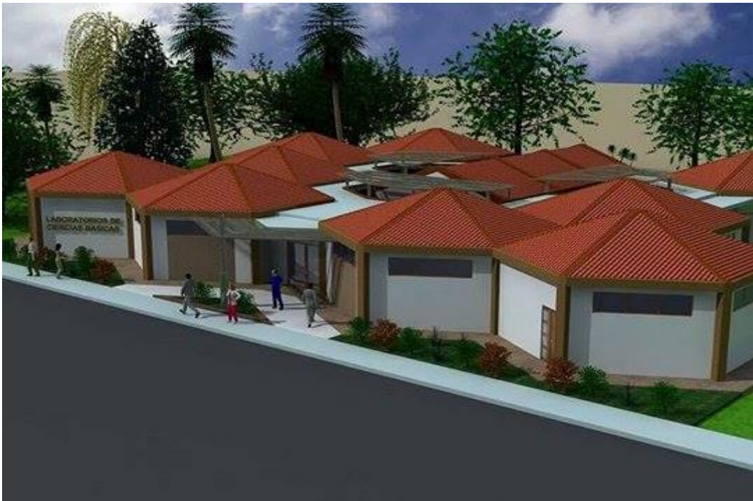
Foto # 14 Vista aérea superior digitalizada del Instituto de Ciencias Básicas una vez realizada la rehabilitación.