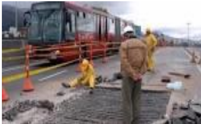
Figura n° 4. Reparaciones que se realizan para la protección de las obras constructivas.