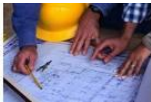
Figura n° 3. Acciones que se realizan para la protección de las obras constructivas.

Son las acciones y trabajos que deben realizarse, continua o periódicamente, en forma sistemática, para proteger las obras físicas de la acción del tiempo y del desgaste por su uso y operación, asegurando el máximo rendimiento de las funciones para las cuales éstas han sido construidas.