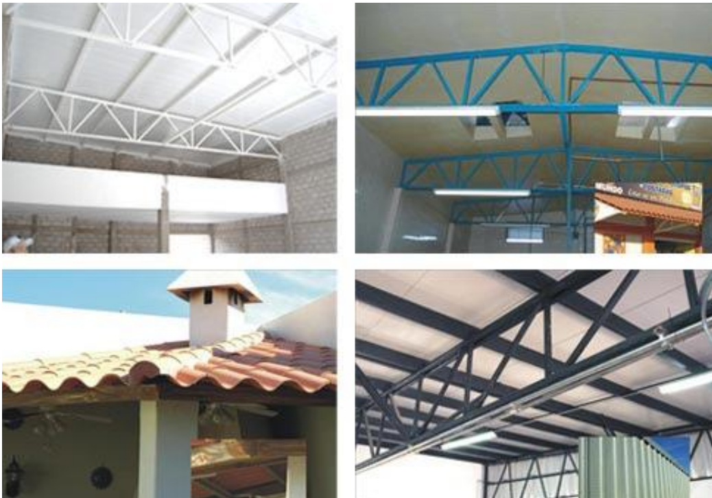
Figura n° 8. Utilización de la pintura anticorrosiva en estructuras.