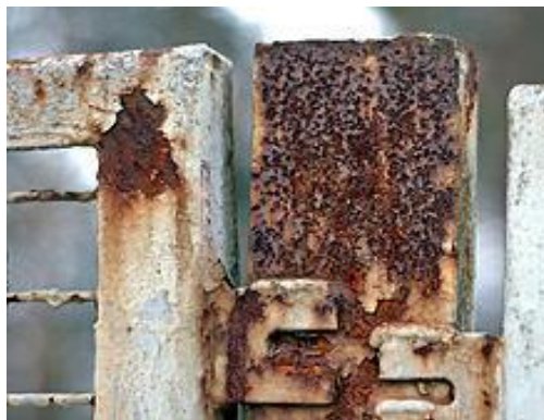
Figura nº 6. Reja oxidada.

La pintura anticorrosiva es una base o primera capa de imprimación de pintura que se ha de dar a una superficie, que se aplica directamente a los cuerpos de acero, y otros metales. Para ello puede usarse un proceso de inmersión o de aspersion, (dependiendo del funcionamiento de la planta de trabajo y de la geometría de la estructura). Éste tiene el propósito principal de inhibir la oxidación del material, y secundariamente el de proporcionar una superficie que ofrezca las condiciones propicias para ser pintada con otros acabados, esmaltes y lustres coloridos.