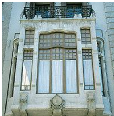
Figura nº 9. Detalles de la ventana.

No obstante, las hojas de la ventana que sirven de cerramiento no deben impedir otro de los aspectos funcionales de ésta: la iluminación. Para permitir el paso de la luz a su través las hojas deben ser acristaladas. Aunque antes del siglo XX existían algunas desventajas, como pueden ser el excesivo soleamiento interior o la propia iluminación en circunstancias no deseadas y la reducción de aislamiento térmico, dadas las prestaciones del vidrio aislante a principios del siglo XXI, se puede considerar que estos inconvenientes han sido resueltos.