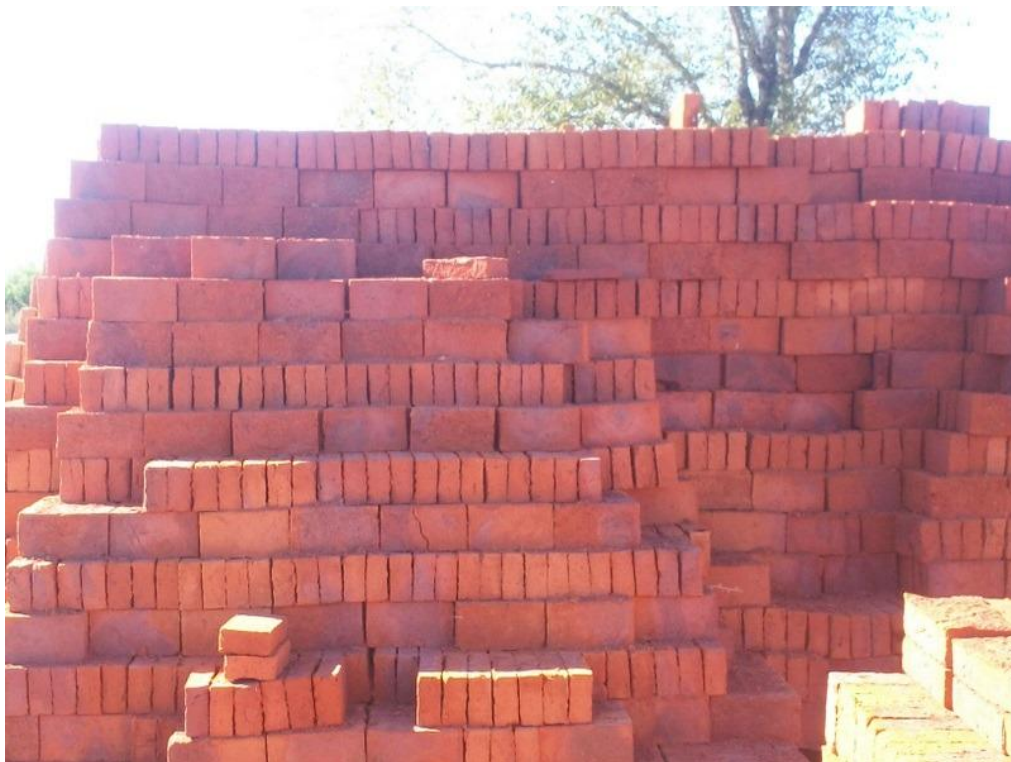
Ilustración 8: Ladrillos Terminados

La última actividad a realizar en el proceso de fabricación de ladrillos en la del enfriamiento, esta dura entre 2 y 3 días, solo cuando esta haya finalizado se podrá destapar el horno, comenzando por la rafa. A partir de aquel momento los ladrillos están completamente listos para ser utilizados en obra. (Nieto, 2011, pág. 188)