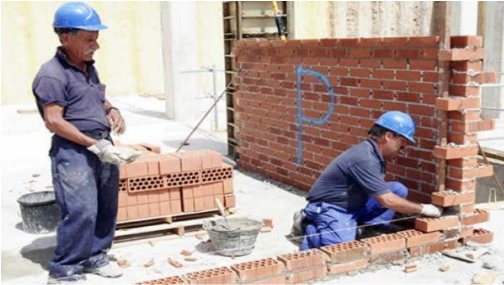
Ilustración 10: Mampostería de Extremos Irregulares