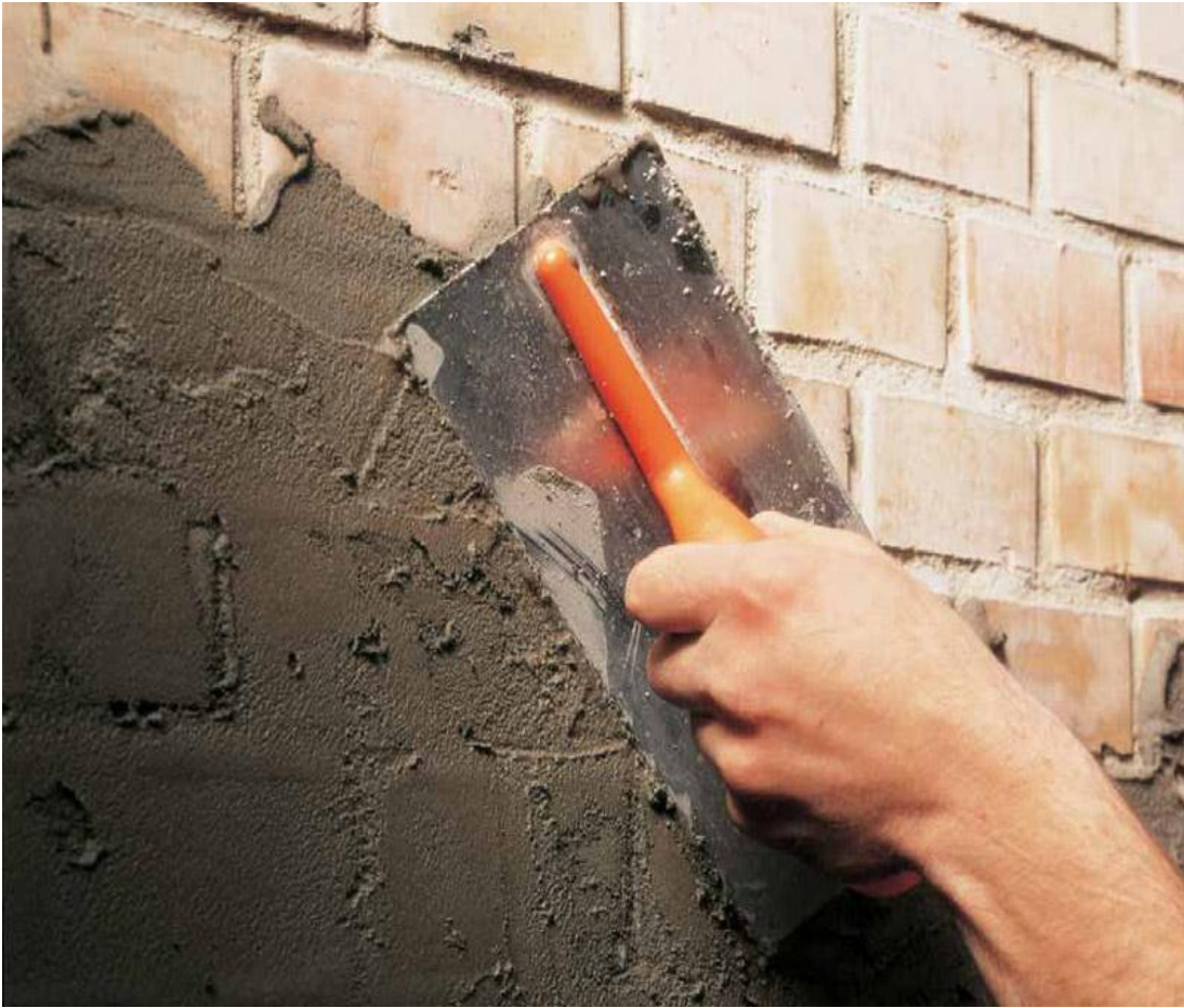
Ilustración 13: Enlucido en mampostería de ladrillo