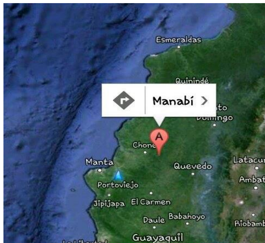
Ilustración 2: Ubicación Geográfica de Manabí

El turismo es uno de los principales atractivos del cantón, la excursión y la aventura son las actividades de mayor frecuencia.