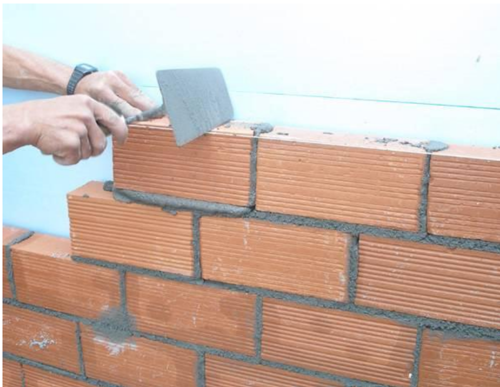
Ilustración 11: Mampostería

En los casos en los que se presentan temperaturas inferiores a los -7° C se suele recomendar levantar una cubierta provisionaria, es posible usar folios, lonas plásticas translúcidos para calentar el ambiente. (Nieto, 2011, pág. 213)