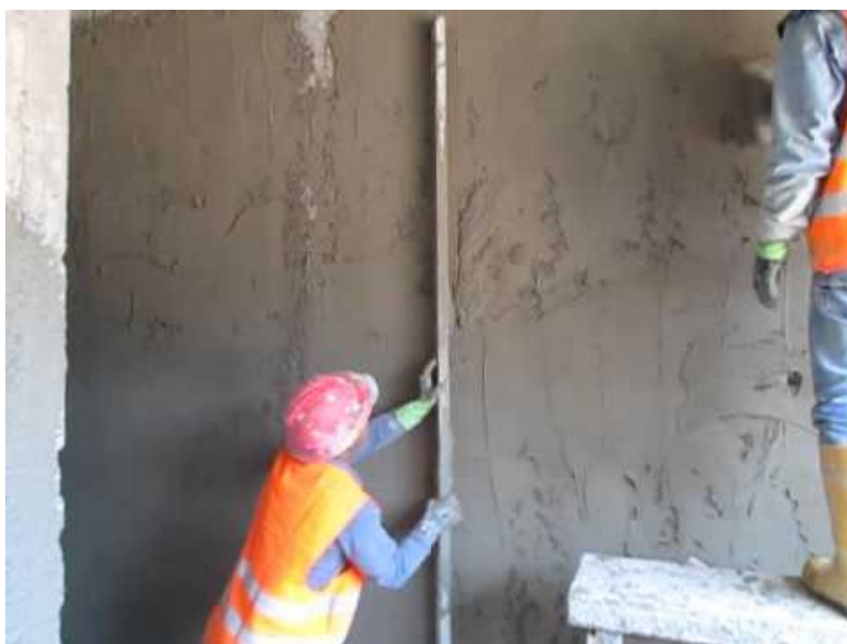
Ilustración 14: Trabajos de enlucido