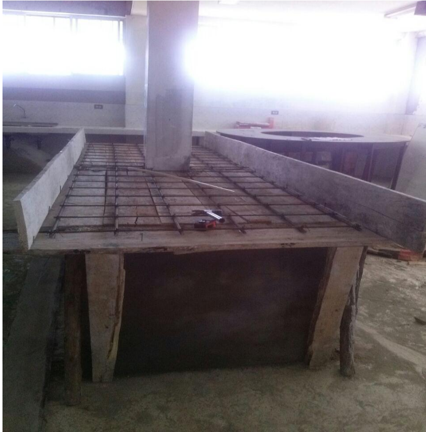
Armado de hierro para los mesones.