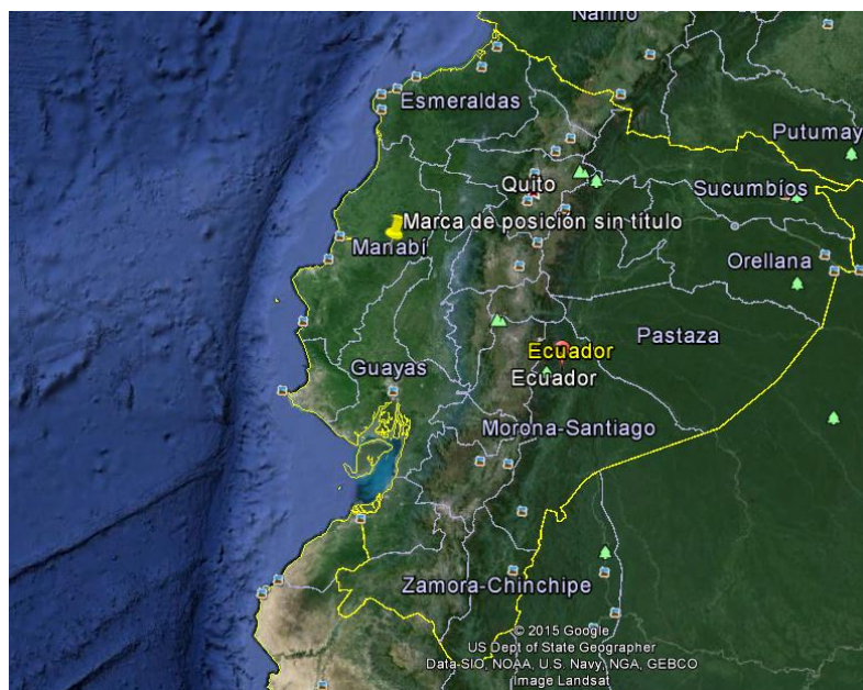
Ilustración 1: Geografía del Ecuador

Ecuador tiene una superficie territorial de 272045 km 2 , incluidas las islas Galápagos. La capital ecuatoriana es Quito y esta ciudad es una de las más antiguas de Sudamérica.