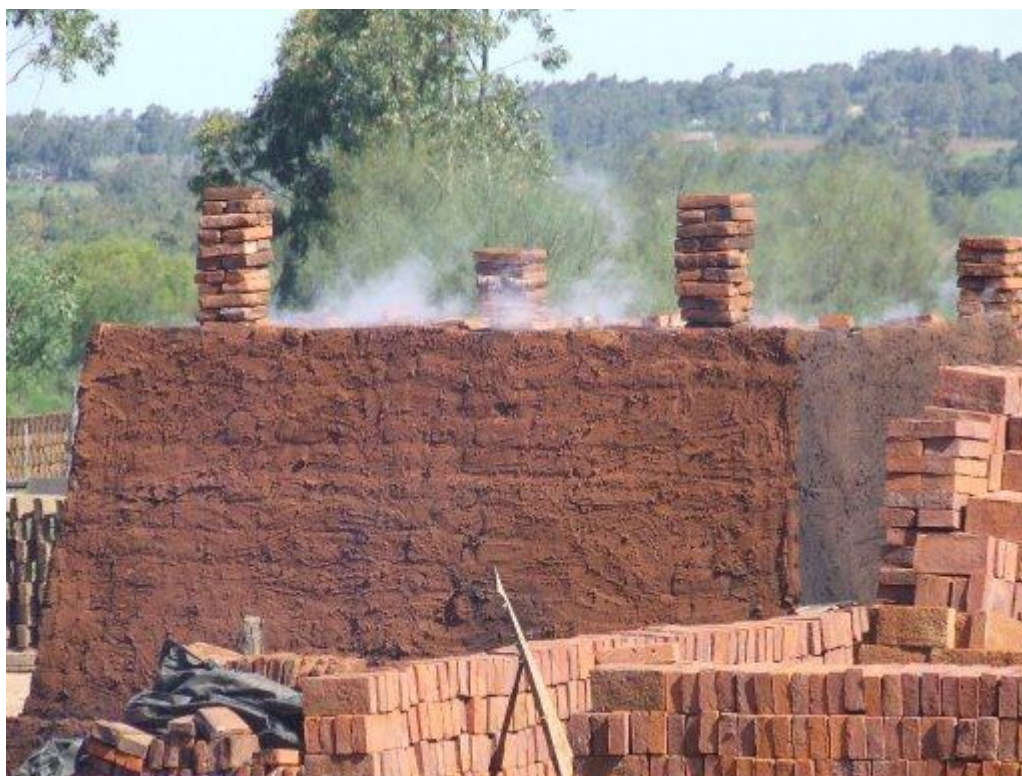
Ilustración 7: Hornos de Ladrillos