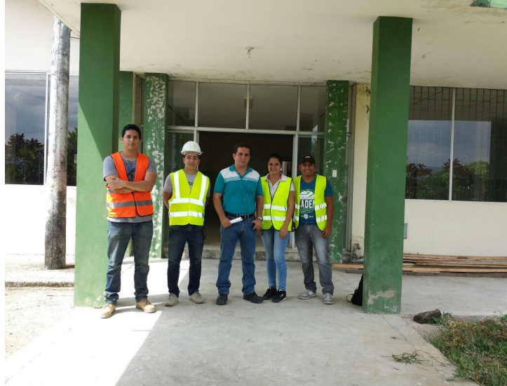
Con el tutor del trabajo titulación en la obra.