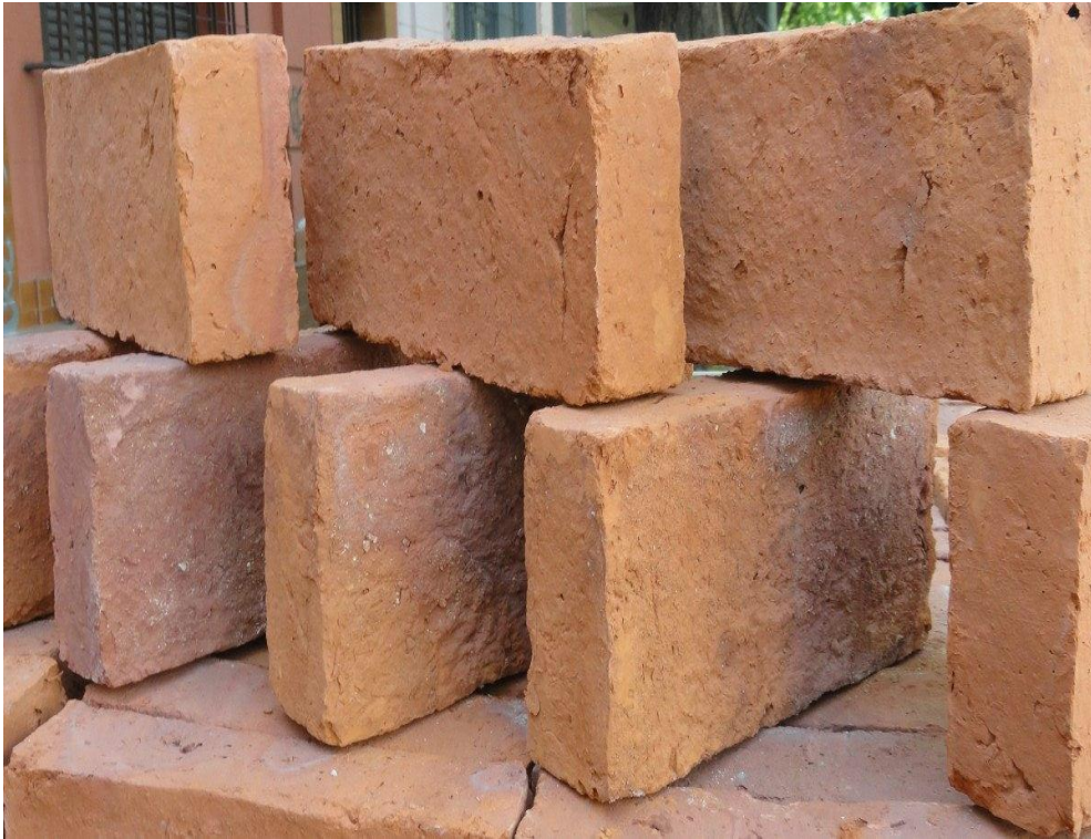
Ilustración 6: Ladrillo común