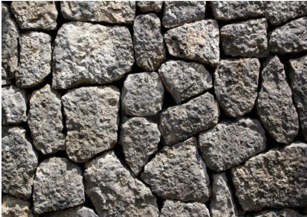
Ilustración 5: Mampostería de Piedra

En cuanto a las rocas existen mucho tipos, la composición, textura, resistencia, color, tamaño y demás características pueden ser aprovechados según el destino de la mampostería y según los conocimientos del profesional responsable de la obra. (Nieto, 2011, pág. 177)