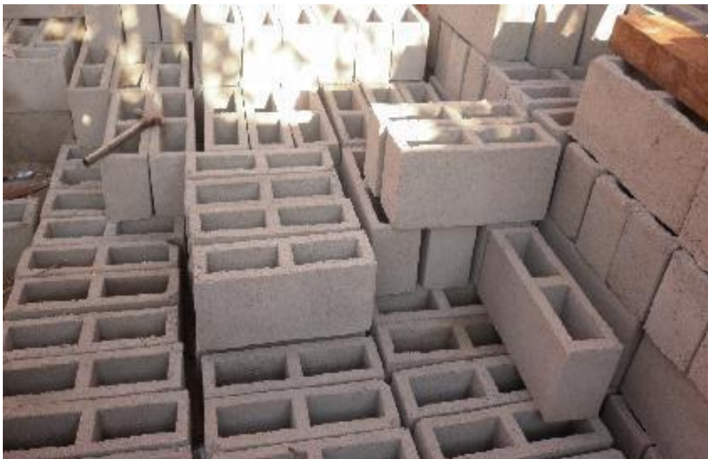
Ilustración 4: Bloques de Cemento

La composición de los bloques es de materiales naturales tratados y moldeados; una parte de arena se mezcla con seis o cuatro partes el cemento; los bloques más resistentes por su parte, se componen de una mezcla de cemento arena y piedra triturada. Un tercer tipo de bloque de cemento, se fabrica con tierra, aunque este último no es recomendó para ser empleado en la construcción. (Walton, 2010, pág. 58)