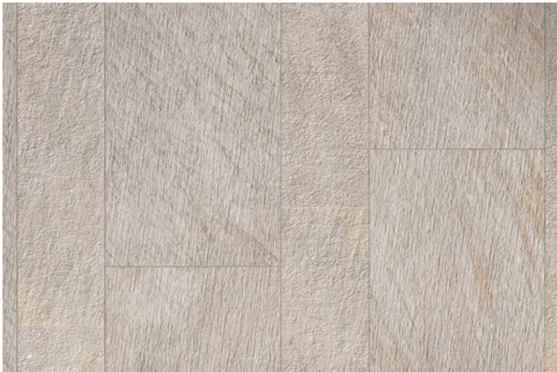
Ilustración 12: Textura del Porcelanato

La absorción de agua de este material es próxima a cero, por tal motivo es necesario utilizar en su asentamiento argamasas especiales, al revés de las tradicionales masas de asentamiento utilizadas para cerámicas y granitos. Otro aspecto necesario de resaltar es que debido a su dureza, será necesario utilizar dispositivos de corte con borde cortante diamantado. (Gonzales Cuevas & Robles Fernández, 2013)