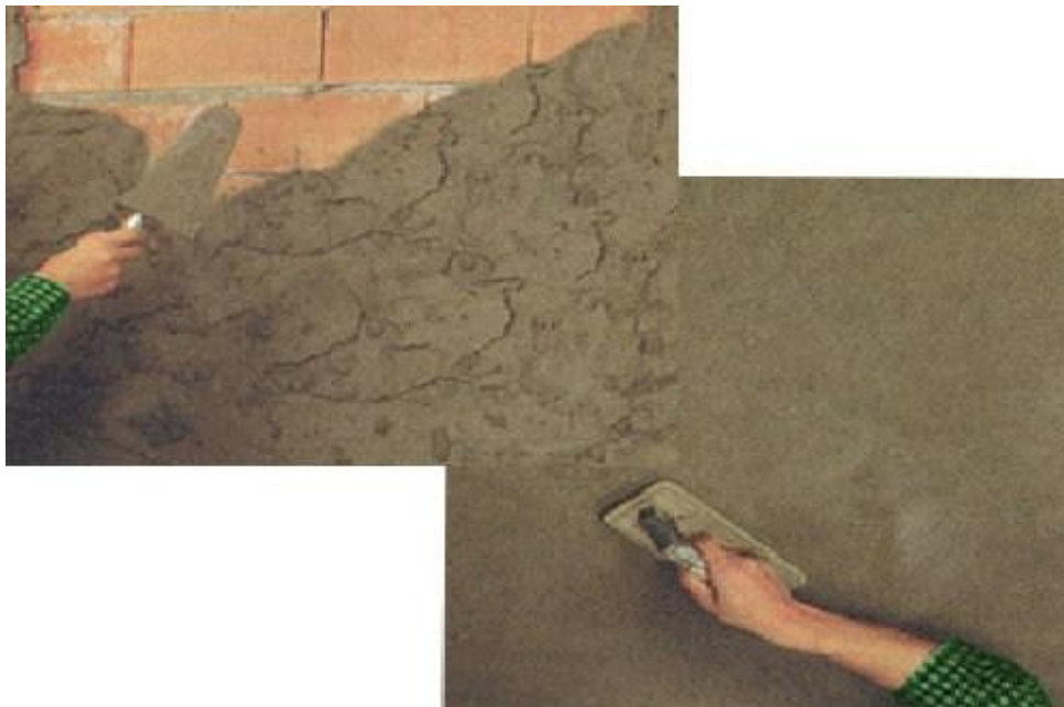
Ilustración 15: Enlucido en capas

Resulta necesario dosificarse adecuadamente la cantidad de arena para evitar las grietas cuando se seca y se contrae el enlucido. Antes de que se asiente por completo la primera capa, se debe raspar para conseguir agarre de la segunda capa. (Walton, 2010)