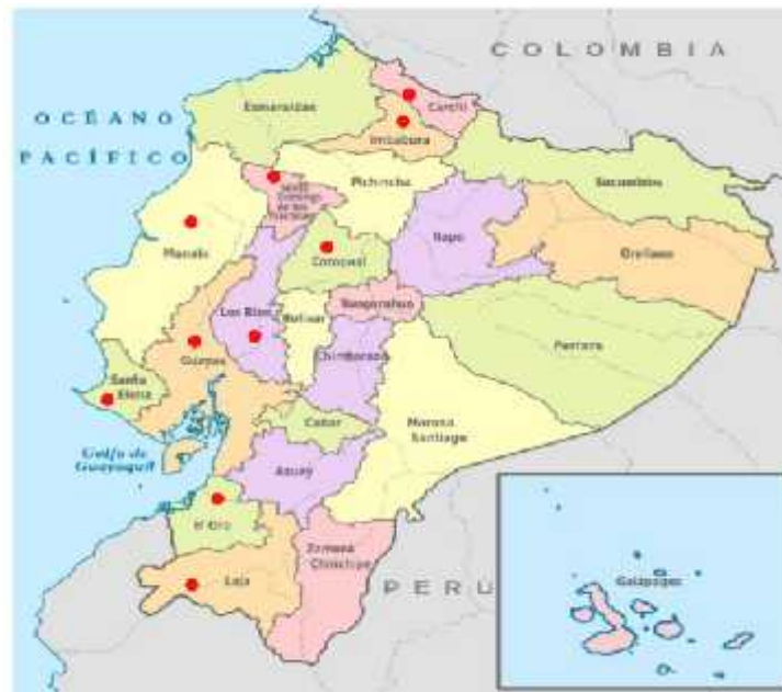
Figura 1. Distribución geográfica de Diaphorina citri Kuwayama en Ecuador. El punto rojo indica las provincias en las cuales ha sido reportada la especie.