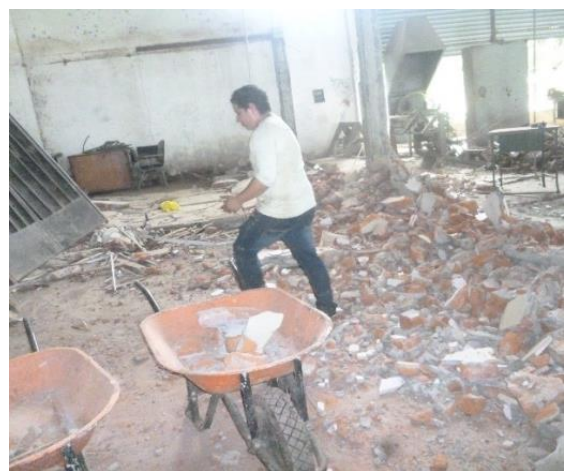
Retiro y limpieza de escombros