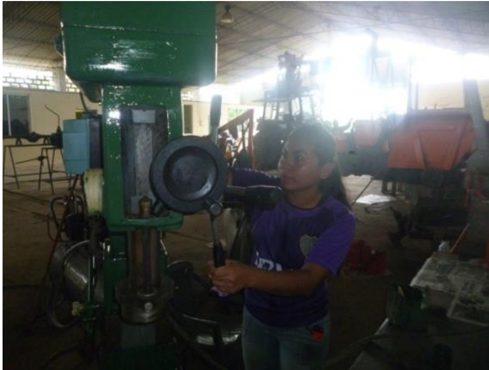
Mantenimiento preventivo del taladro pedestal