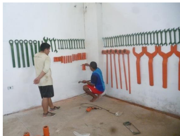
Ubicación de llaves y dados