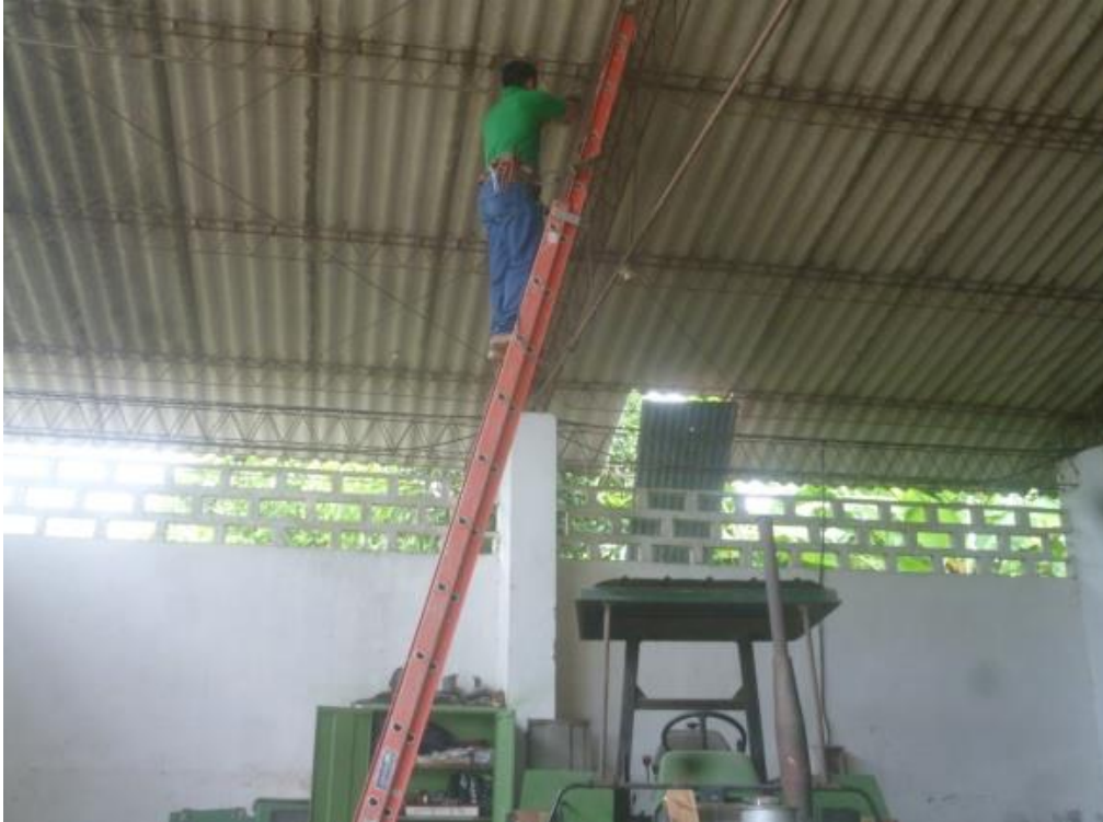
Mantenimiento preventivo de las instalaciones eléctricas