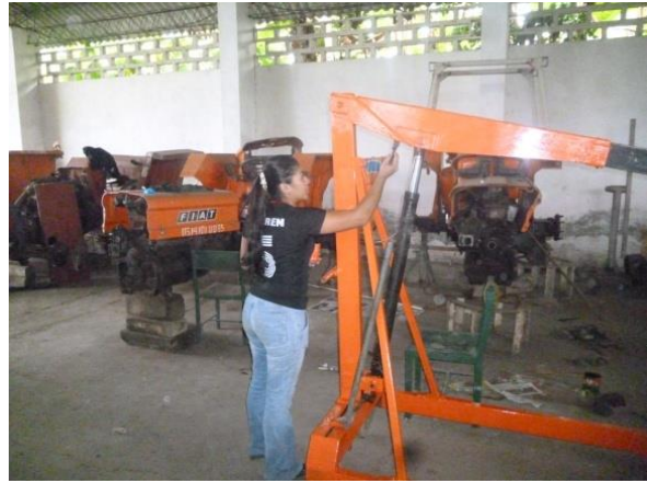
Mantenimiento preventivo de brazo hidráulico