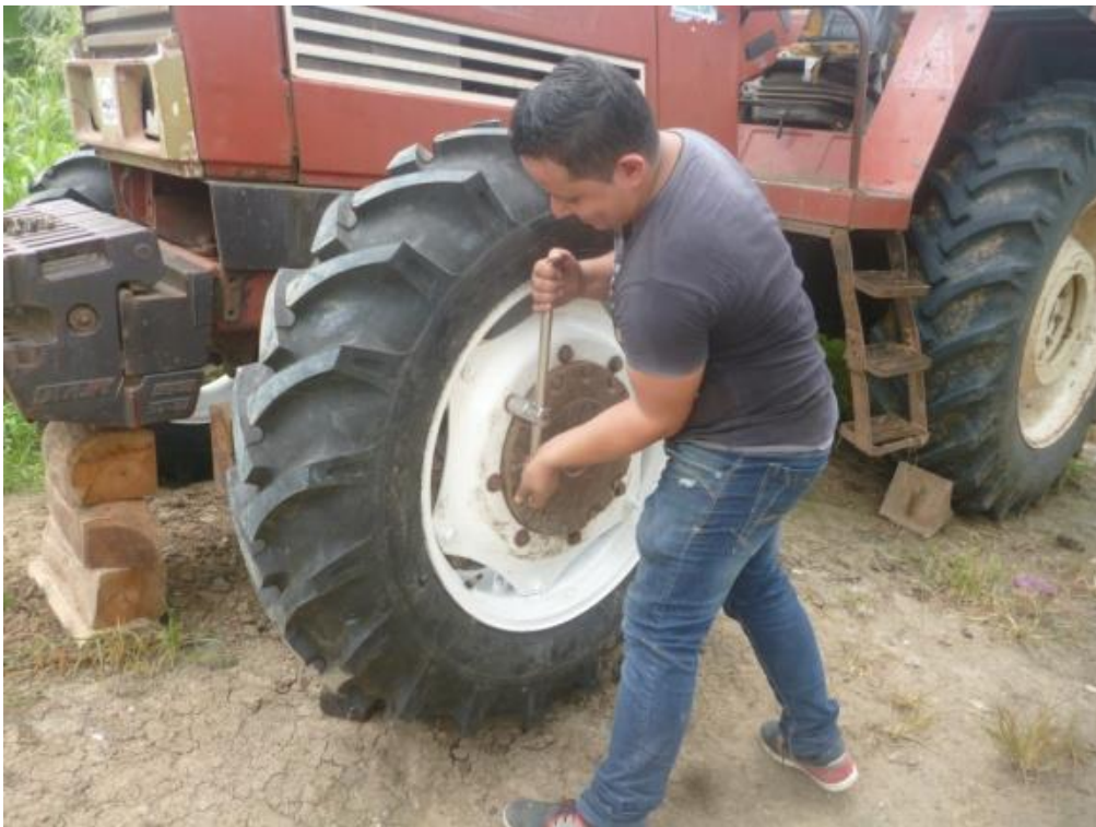
Cambio de neumáticos del tractor FIAT 1180-DT