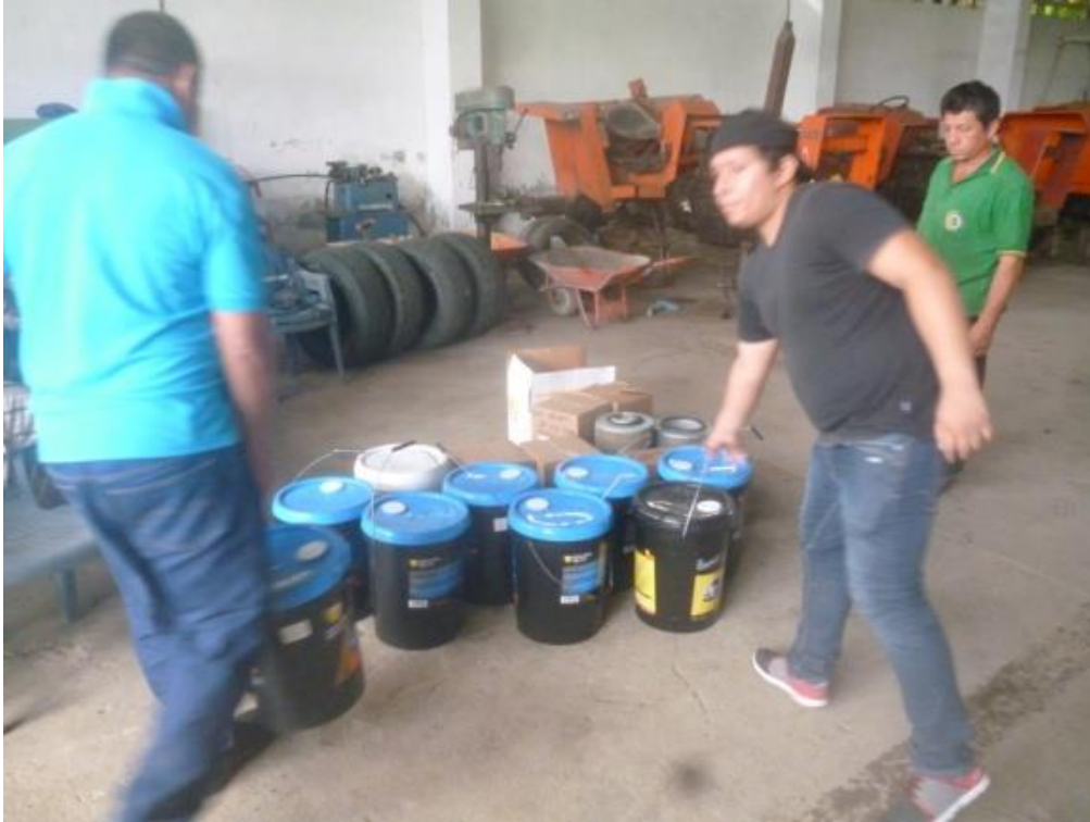
Adquisición de lubricantes para tractores