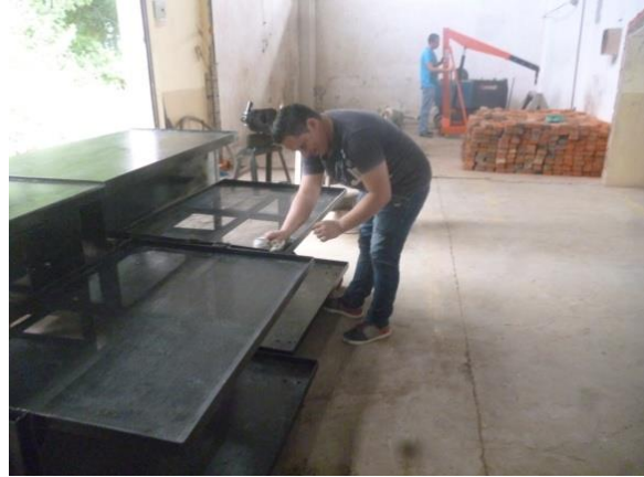
Mantenimiento a carretillas para lavar piezas