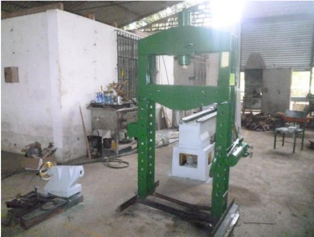
Mantenimiento preventivo de la prensa hidráulica