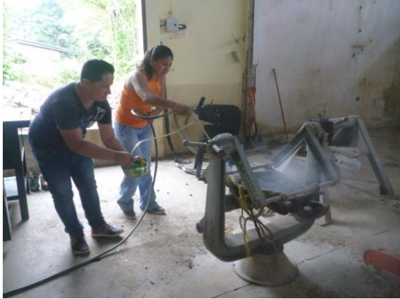
Mantenimiento de caballo giratorio