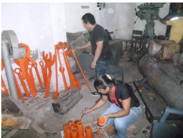
Mantenimiento de llaves y dados