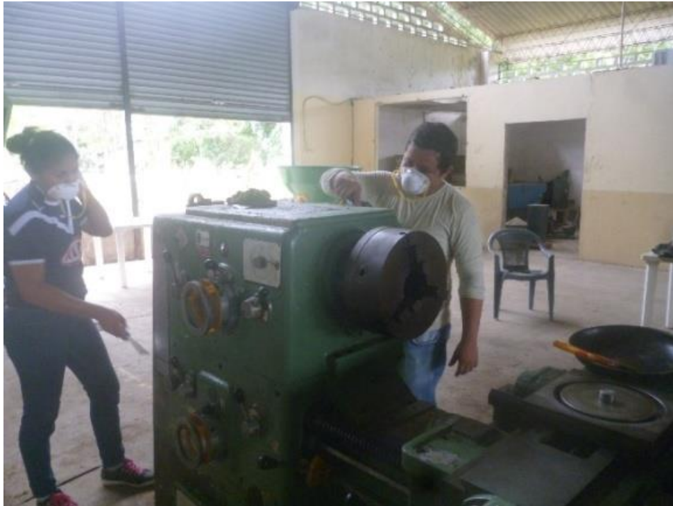
Mantenimiento correctivo y preventivo del torno