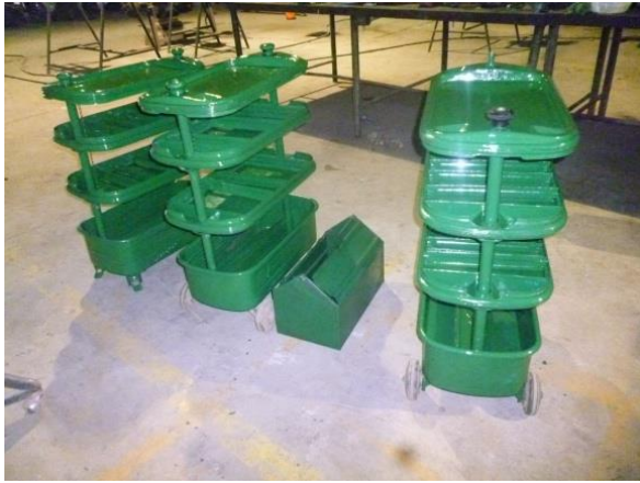
Mantenimiento de carretillas porta herramientas