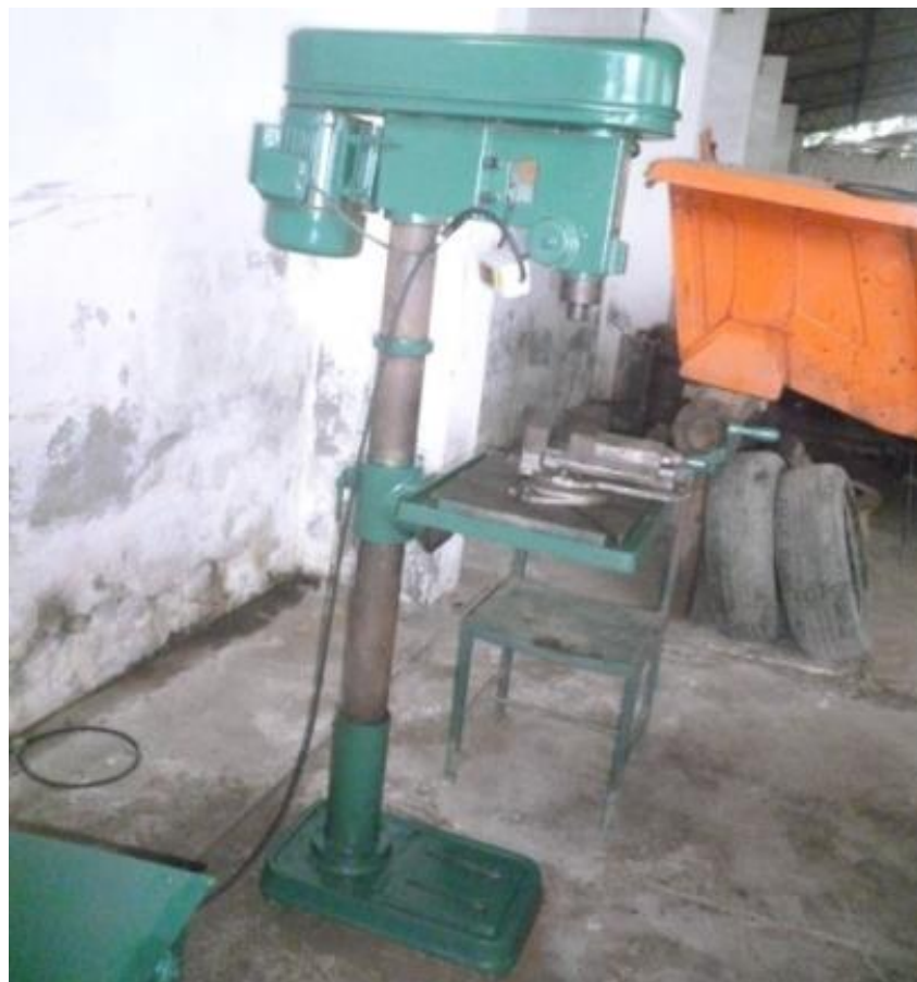
Taladro pedestal despues del mantenimiento preventivo