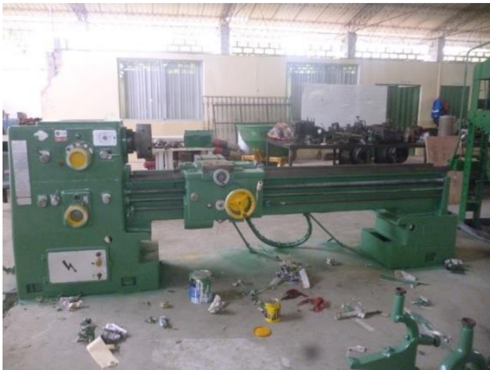
Torno despues del Mantenimiento correctivo y preventivo