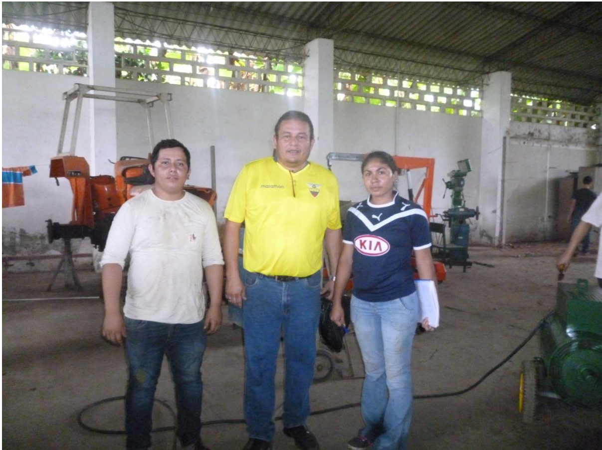
Tutor y autores del trabajo de titulación