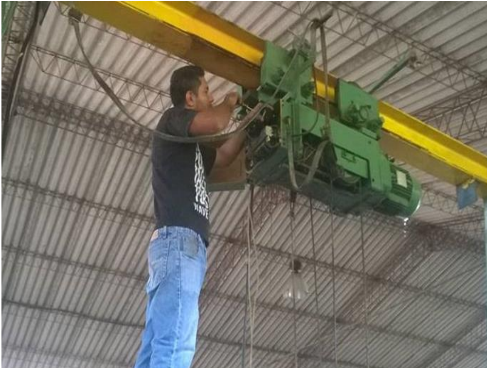
Limpieza y cambio de contactores del tecle eléctrico móvil