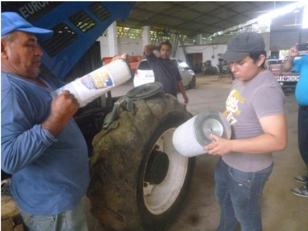
Cambio de filtros a tractores