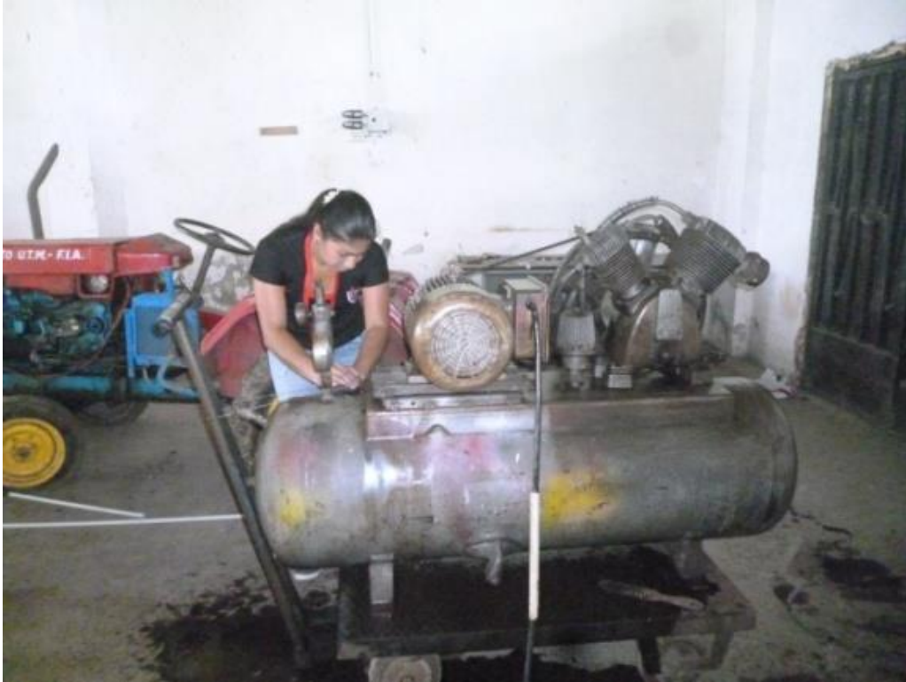
Mantenimiento preventivo del compresor grande