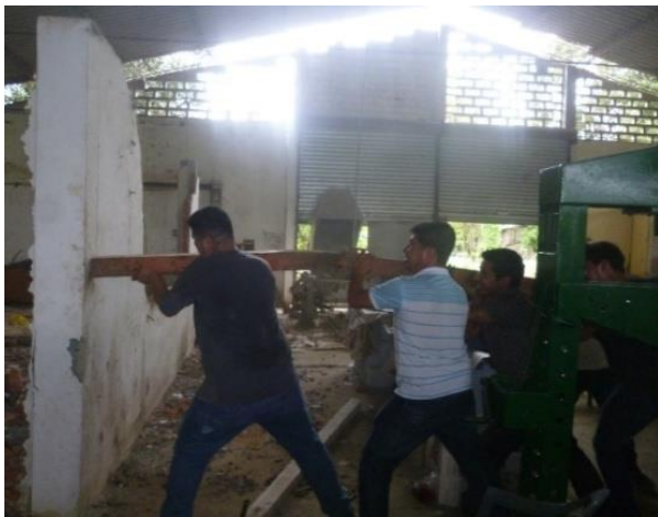
Demolición de bodega