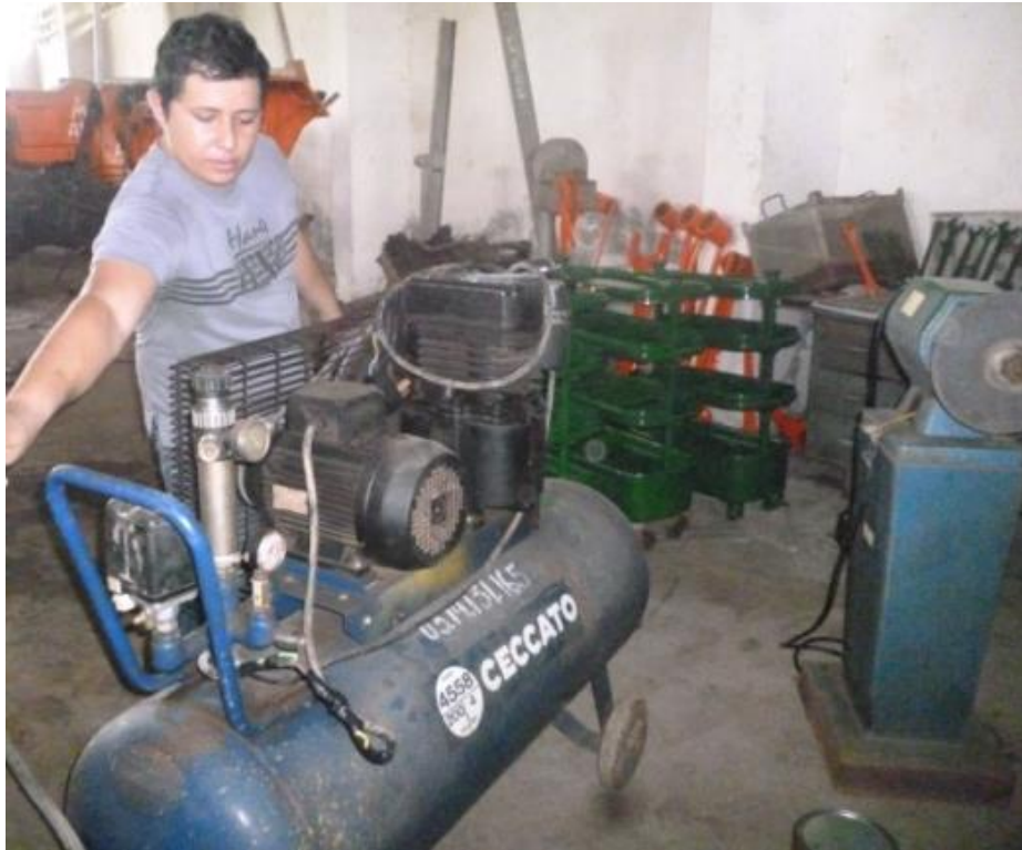
Mantenimiento preventivo del compresor pequeño