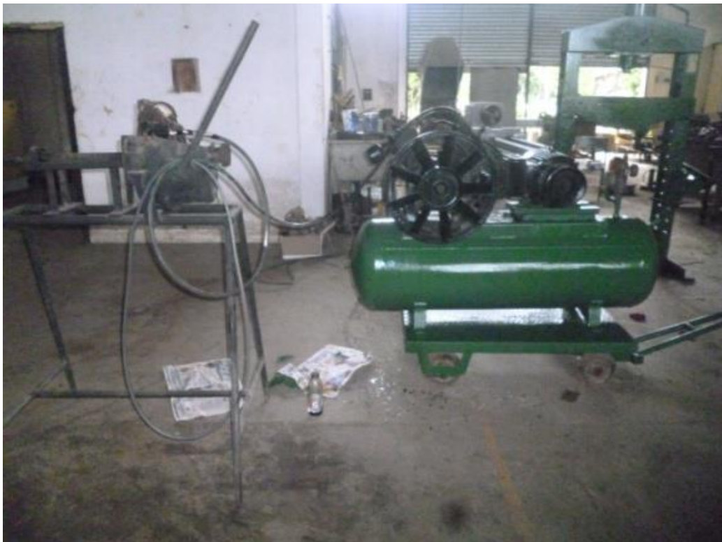
Compresor grande despues del mantenimiento preventivo