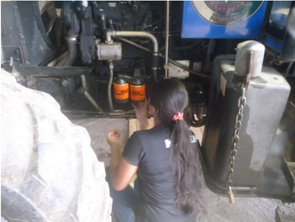
Cambio de aceite a tractores