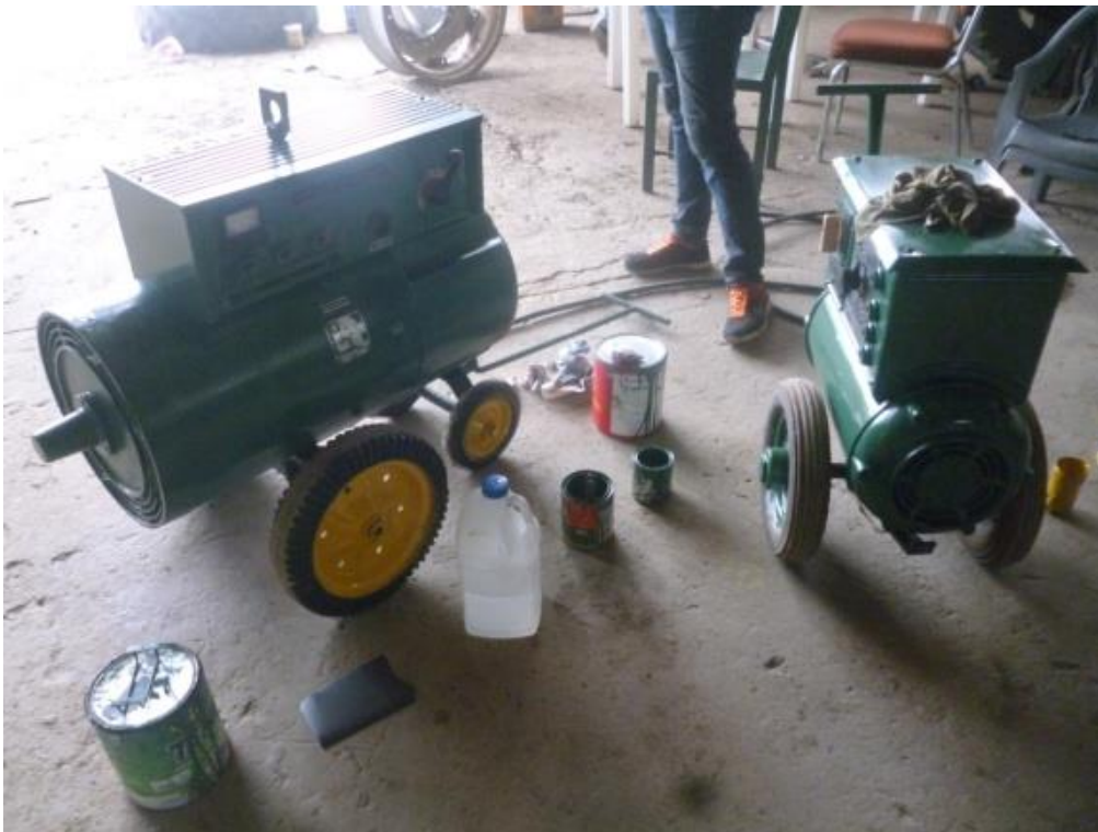
Mantenimiento preventivo de las soldaduras de baja y alta capacidad