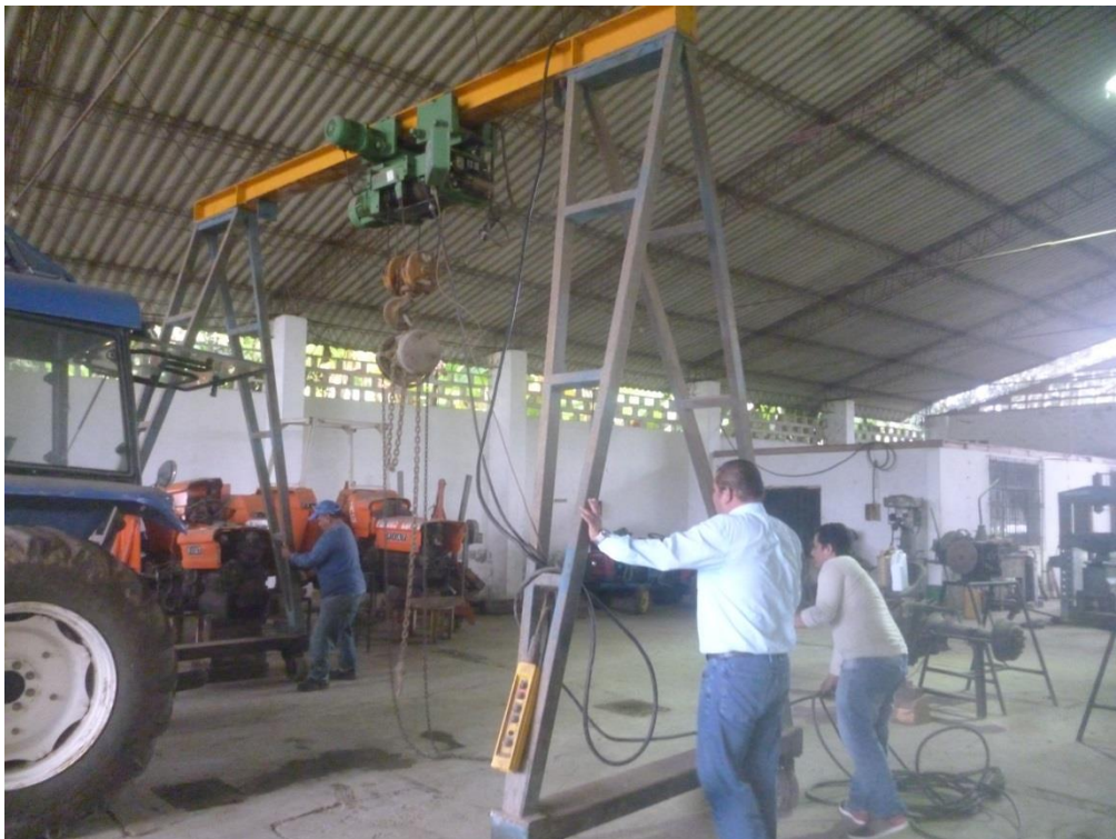
Mantenimiento preventivo del tecle eléctrico móvil