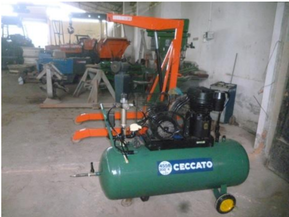
Mantenimiento preventivo del compresor pequeño