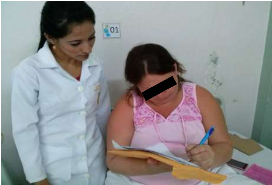
FOTO 6: Aplicando las encuestas a las mujeres solteras embarazadas en el subproceso de Gineco- Obstetricia del Hospital Dr. Verdi Cevallos Balda.