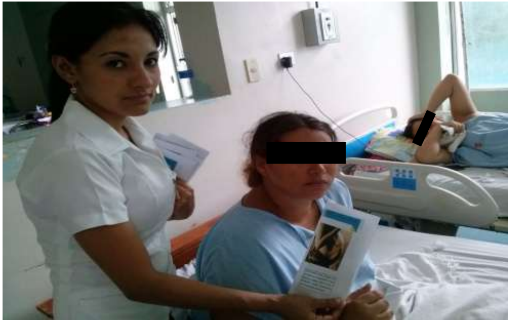
FOTO 3: Entrega de trípticos con información sobre los FACTORES DE RIESGOS EN EL EMBARAZO EN MADRES SOLTERAS.