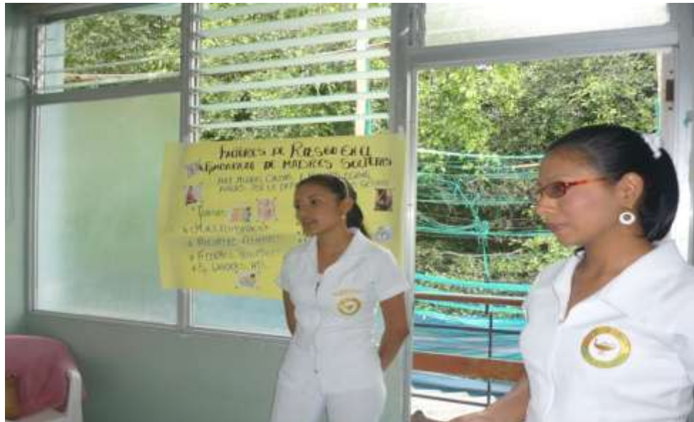
FOTO 2: Impartiendo información sobre charla educativa a las madres solteras embarazadas sobre FACTORES DE RIESGOS EN EL EMBARAZO EN MADRES SOLTERAS.