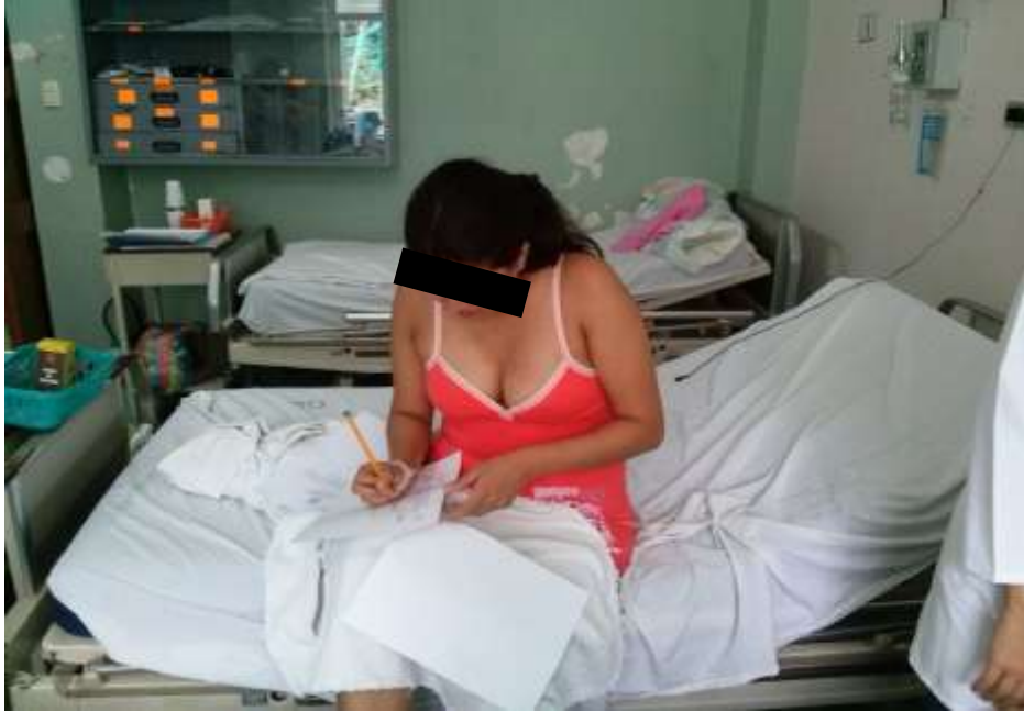
FOTO 5: Aplicando las encuestas a las mujeres solteras embarazadas en el subproceso de Gineco- Obstetricia del Hospital Dr. Verdi Cevallos Balda.