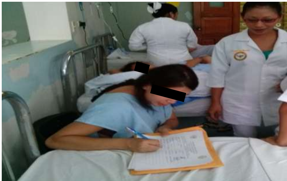
FOTO 4: Recogiendo firmas de las mujeres embarazadas solteras que estuvieron presente en la charla educativa.