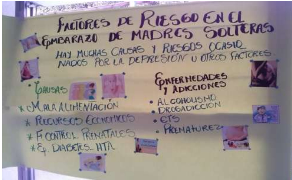
FOTO 1: Preparación del rotafolio que será de ayuda visual para impartir charlas educativas a las madres solteras embarazadas que se encuentran hospitalizadas en el subproceso de Gineco Obstetricia