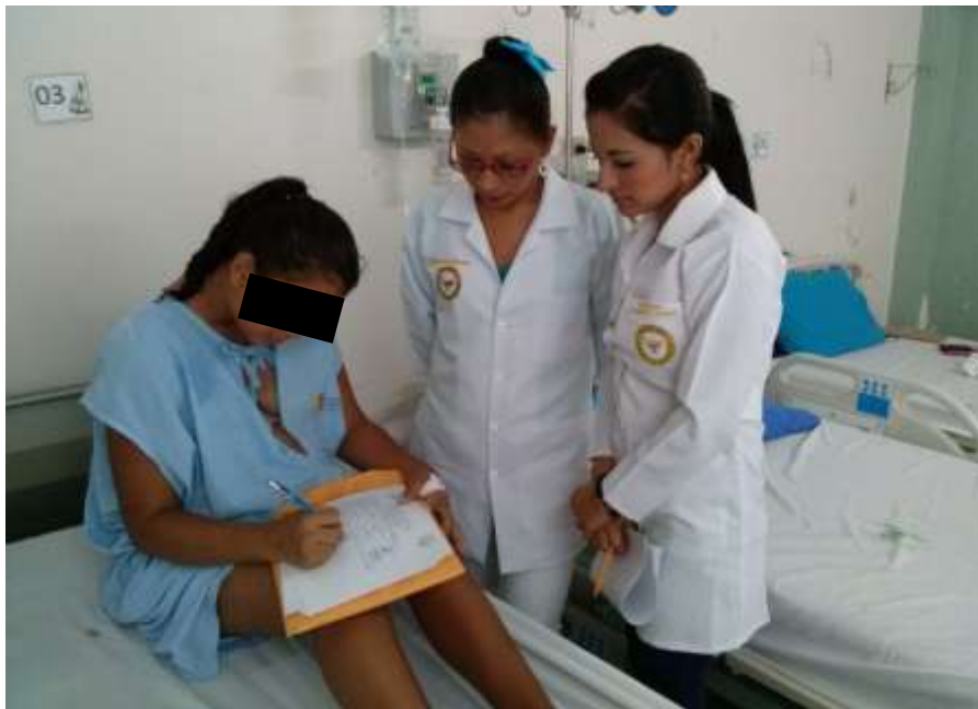
FOTO 8: Aplicando las encuestas a las mujeres solteras embarazadas en el subproceso de Gineco- Obstetricia del Hospital Dr. Verdi Cevallos Balda.